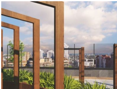
квартира №28 Дом №3 / 7 Этаж