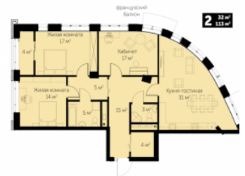
ип планировки: емья с ребенком