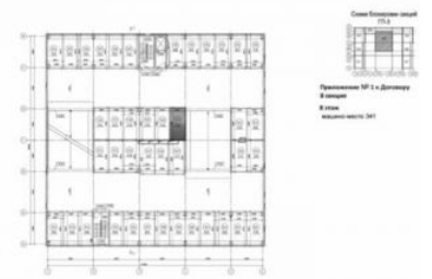
Застройщик ООО Специализированный застройщик «К2»

«Многоэтажные жилые дома с объектами инфраструктуры в границах улиц Березовая, Республикалец в г. Томске. Жилой дом ТТ-3а Приложение № 1 к Договору 8 секция 9 этаж КВ 424