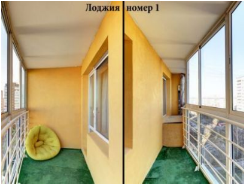
Лоджия номер 1