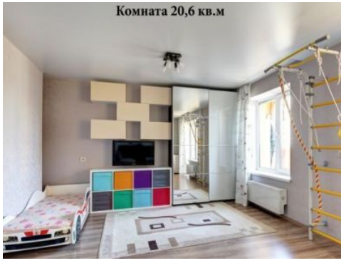
Комната 20,6 кв.м