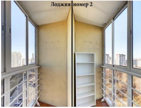
Лоджия номер 2