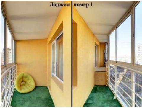
Лоджия номер 1