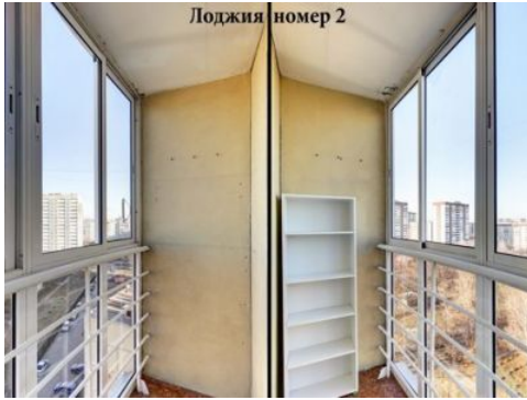
Лоджия номер 2